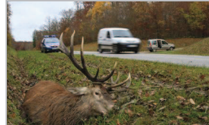
« Aberrant de procéder à l'enfouissement ou à l'équarrissage de l'animal percuté ».

Gibier renversé Le donner aux Restos du cœur ? De P. Didelot de Pouxeux le 21 avril. « Suite à la lecture de l'17 avril d'un fait divers concernant la collision entre un camion et un cerf, et de l'article sur les réflexes à avoir en cas de collision avec du gibier (V.M. du 20 avril), il m'a paru anormal voire aberrant le fait de procéder à l'enfouissement ou à l'équarrissage de l'animal percuté (sauf si on ne connaît pas l'heure et les circonstances de la mort des animaux.) Je sais qu'il existe des lois sur la chasse et sur l'hygiène agroalimentaire, mais ne pourrait-on pas