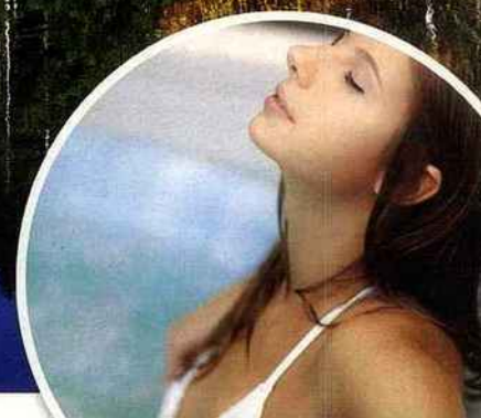
Une piscine au style Art déco pour le Palmarium de Vittel.