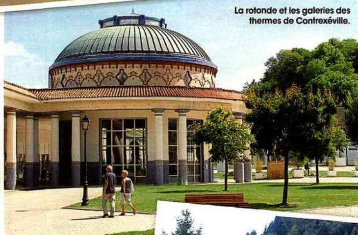
La rotonde et les galeries des thermes de Contrexéville.

Tourisme-lorraine.fr . Tourismevosges.fr .